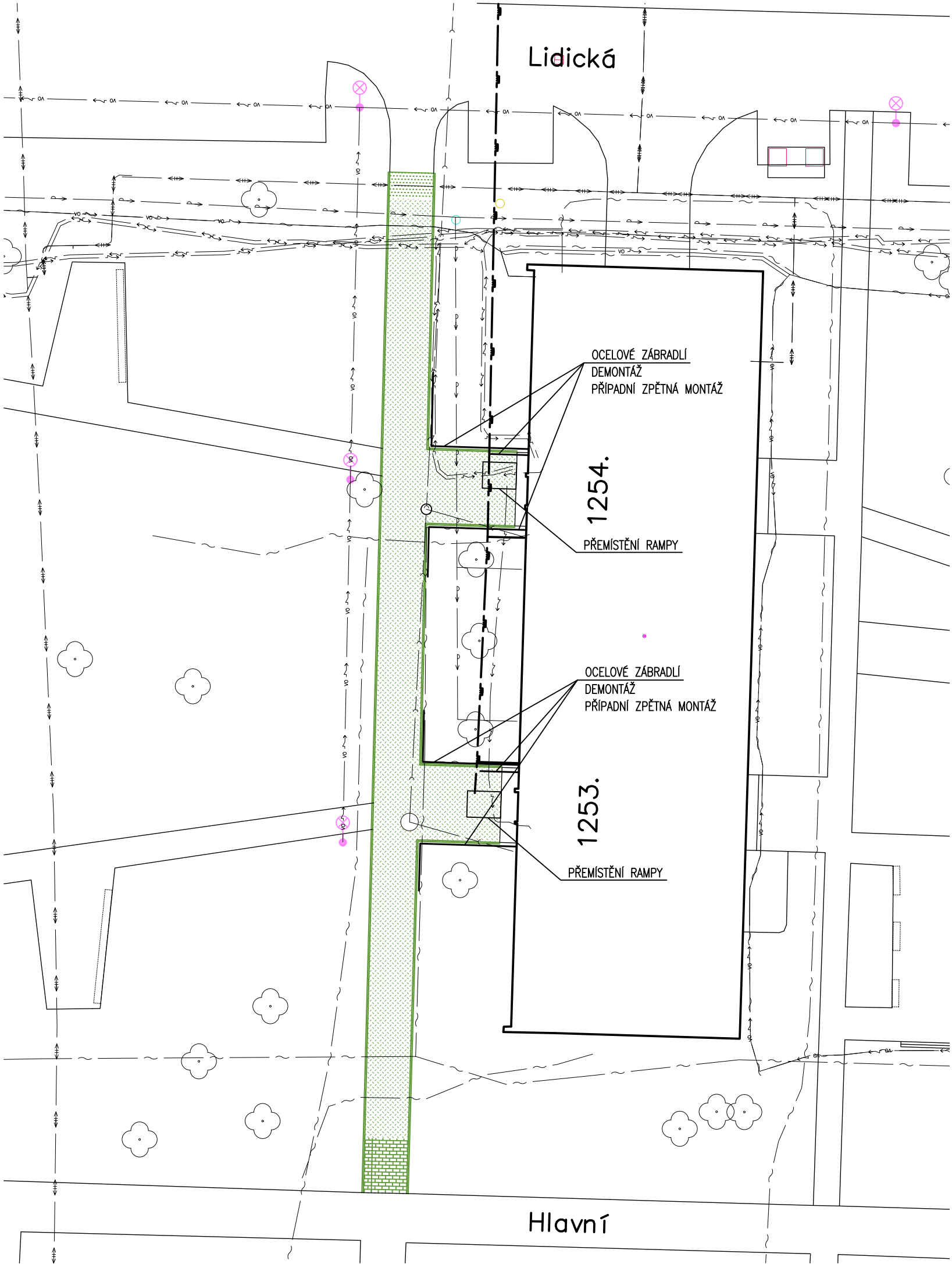
OCELOVÉ ZÁBRADLÍ – DEMONTÁŽ/PŘÍPADNÍ ZPĚTNÁ MONTÁŽ